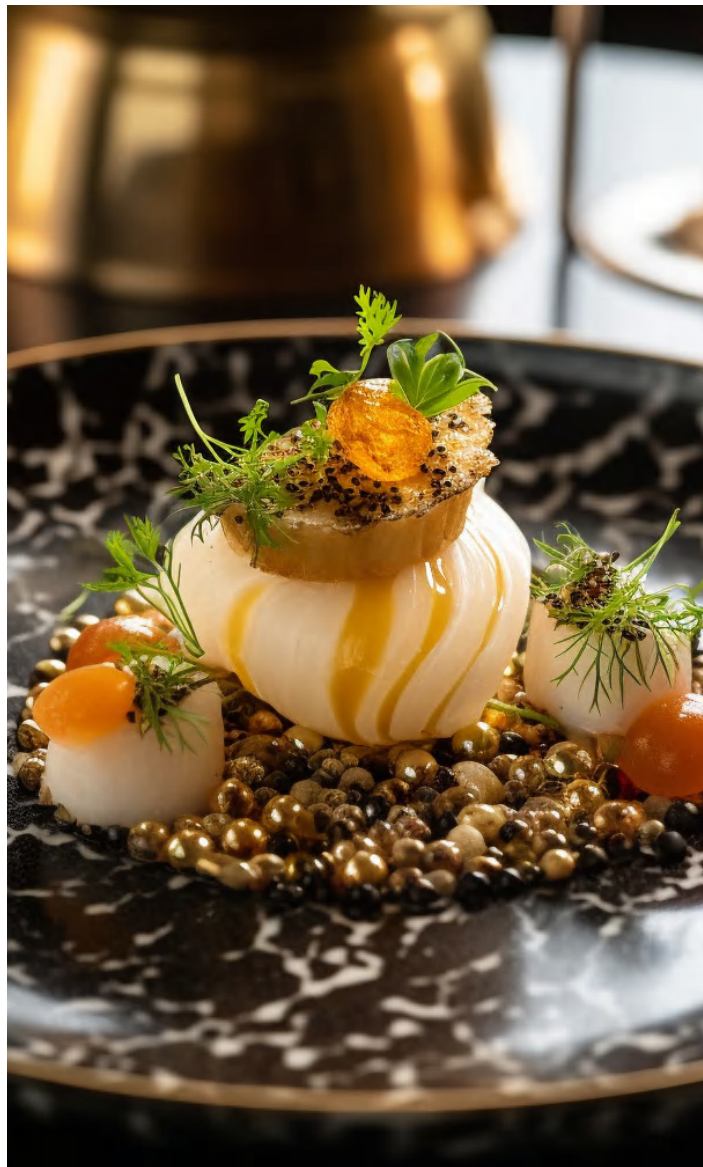
Sitae ped magnitium